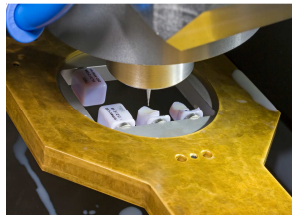
Spannaufnahme für Glaskeramik-Blöcke