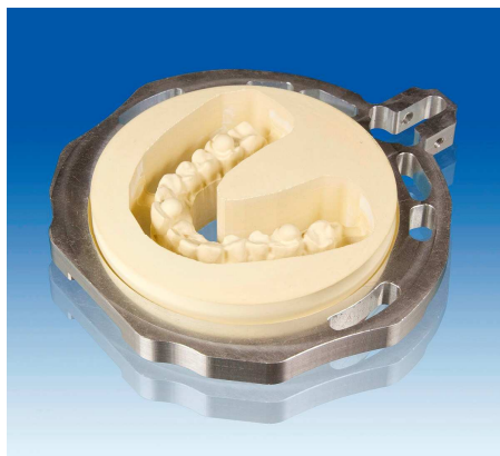
Modell-Fertigung über Nacht

Er bietet nicht nur die effektive Möglichkeit, Zahnersatz mannlos produzieren zu können, sondern greift schon heute die Anforderungen auf, die sich dem Zahntechniker mit der Entwicklung und Verbreitung des interoralen Scanners in naher Zukunft stellen werden.