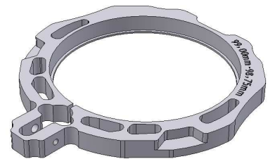
Klemmring für Rohlinge in Rondenform